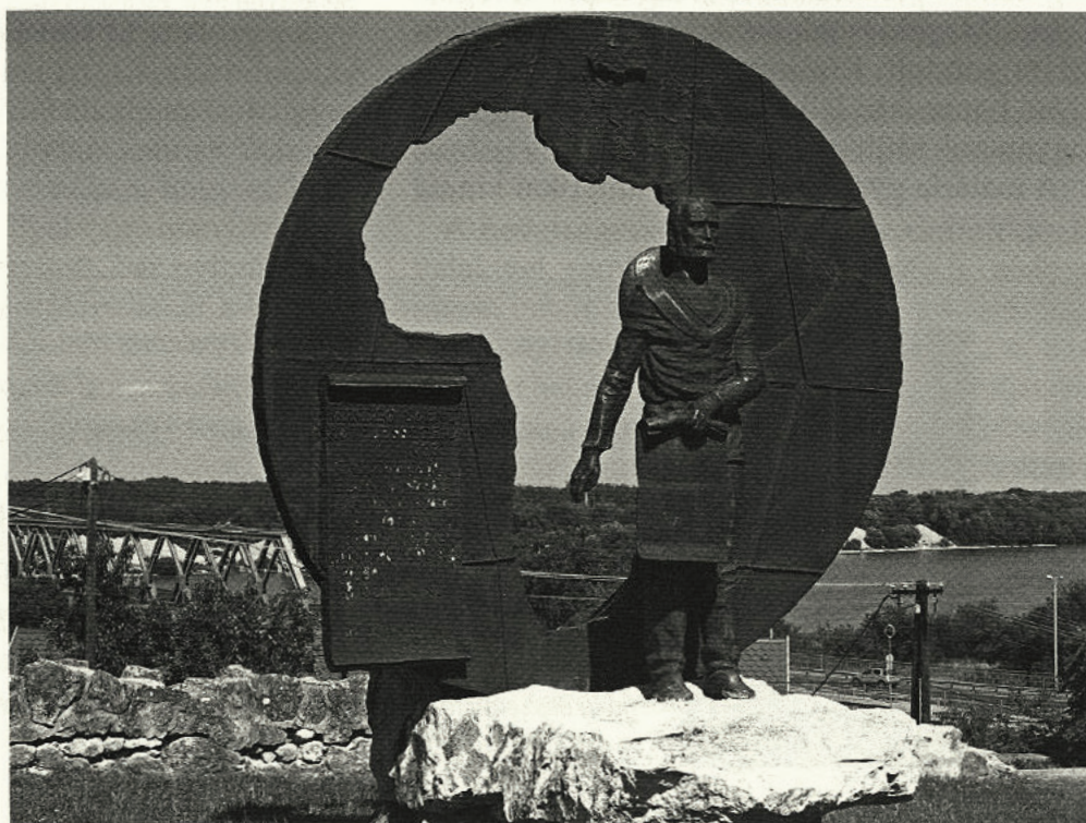
Magyar László emlékmű Dunaföldváron, hol gyermekkorát töltötte

esőzések. Azonban itt is két különböző évszak van, melyekben nagyobb vagy kisebb forróság uralkodik... Május, június, július, augusztus és szeptember havakban, midőn a nap az éjszakai félgömbön mulat, a levegő a tengerpartok közelében, bizonyos szélességre kelet felé, nappal ködös, s ekkor a hőmérő ritkán mutat 20 R foknál [25 °C] többet... a többi hónapok alatt, midőn a nap a déli félgömbön mulat... oly ropant forróság uralkodik, hogy az csaknem kiállhatatlan volna, ha a tenger felől rendszeren déltájban fúvó passzátszél (viracao) annak erejét nem mérsékelné; a hőmérő ekkor 28, sőt 34 R fokot [35–42,5 °C] is mutat az árnyékban... kivált március és április havakban tapasztalják az európaiak az itteni éghajlat öldöklő befolyását... azon évszakot közönségesen »carneiradó«-nak, azaz húsnyúzóznak nevezik...” „A csakhamar beköszöntő forróház (febre maligna), ha jó ápolás vagy inkább a betegnek szerencsés testalkotása azonnal erőt nem vesz a betegségen, három vagy négy nap múlva örökre megszabadítja őt az élet szenvedéseitől. Bámulatra méltó a gyorsaság, mellyel a forró és ernyesztő éghajlat a mérsékelt égöv alatt született egyének életerejét fölemészti, s az életkor különböző szakaszait megrövidíti. Egy 25 éves férfi, ki két évig itt mulatván, rendszeren sok szenvedés után végre az éghajlatot megszokta, 10 esztendő emésztett föl az életéből, és 35